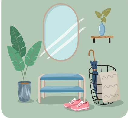
Llegar a casa y descalzarse