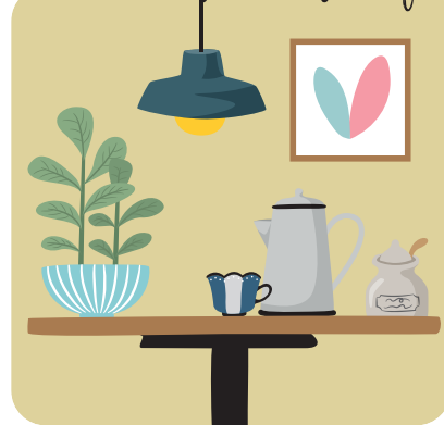
Tomar un buen café