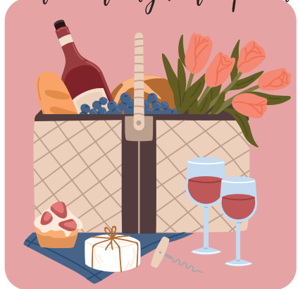
Comer con alguien especial