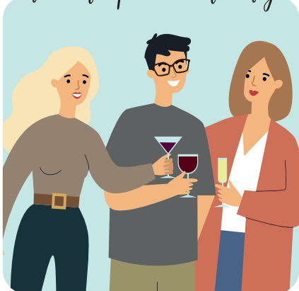
Tomar un aperitivo con amigos