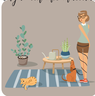
Jugar con mis mascotas